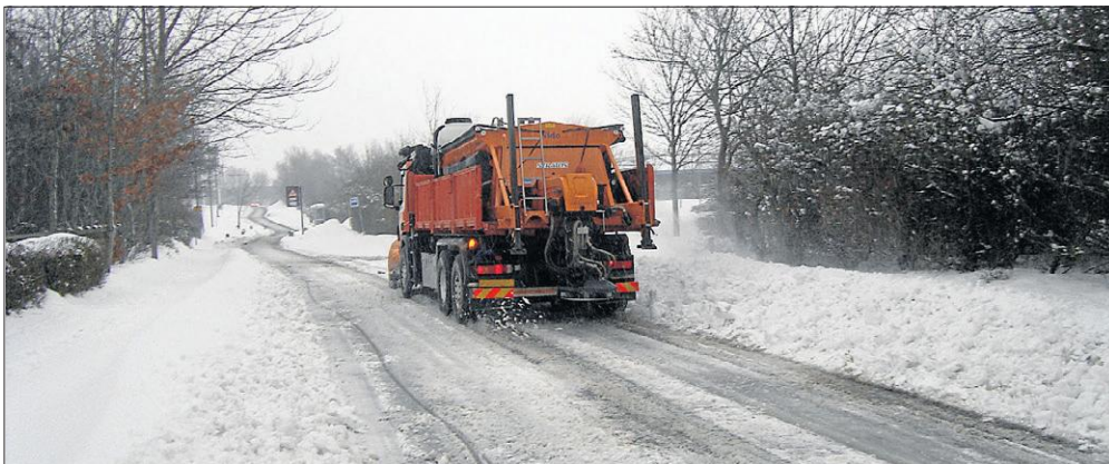
En ting er de effektive salt- og snerydningsmaskiner, et andet er det datagrundlag, der styrer indsatsen.