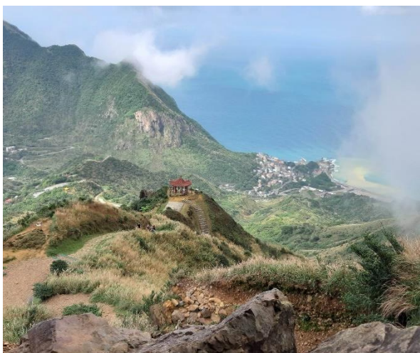
Billede 4 - Hiking trail

Noget af det der er anderledes på universiteterne på Taiwan, er at de har et hav af klubber og aktiviteter man kan deltage i udenfor undervisningstiden. Der er utallige sports og kulturelle klubber. Personligt deltog jeg i aktiviteter indenfor blandt andet traditionelt kinesisk dans, keramik og bouldering.