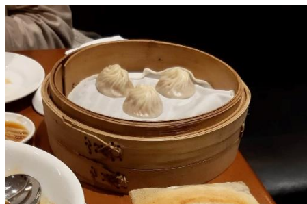
Billede 5 - Xiaolongbao

I weekender eller på helligdage var jeg også rundt med mine medstuderende og andre udvekslingsstudende rundt og rejse til forskellige dele af Taiwan. Vi fik oplevet rigdommen af kultur og natur som Taiwan har at byde på. Og vi var rundt til alt fra templer og nattemarkeder til de mange flotte strande og nationalparker. Derudover fik vi også muligheden for at deltage i forskellige kulturelle begivenheder, som Efterårsfestivalen og Lanternefestivallen. Og vi fik prøvet mange af de lokale delikatesser.