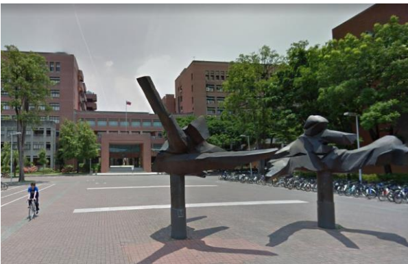
Billede 1 - NCKU campus

I forbindelse med min kandidatuddannelse i Veje og trafik på Aalborg Universitet, fik jeg mulighed for på tredje semester at tage på et udvekslingsophold. Jeg valgte at tage på udvekslingsophold til National Cheng Kung University (NCKU) i Tainan på Taiwan. Universitetet er blandt andet kendt for deres ingeniørstudier, og jeg fandt at de også havde fag indenfor transport, som kunne være relevant for mit studie her i Danmark. Jeg håbede også på at kunne få mere indblik i, hvordan andre lande håndterer transport og infrastruktur. Samtidig fik jeg også muligheden for at opleve en anden kultur, lære et fremmedsprog og møde mennesker fra hele verden.