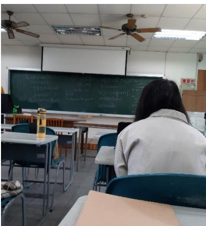
Billede 3 - Klasseundervisning

I kurset "Multivariate analysis" arbejdede vi med forskellige analysemetoder med statistik. I begyndelsen skulle vi lære at regne i hånden, før vi senere arbejdede i excel og blev sat ind i brugen af softwareprogrammet SPSS til at lave forskellige statistiske analyser.